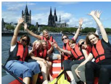
Rafting auf dem Rhein